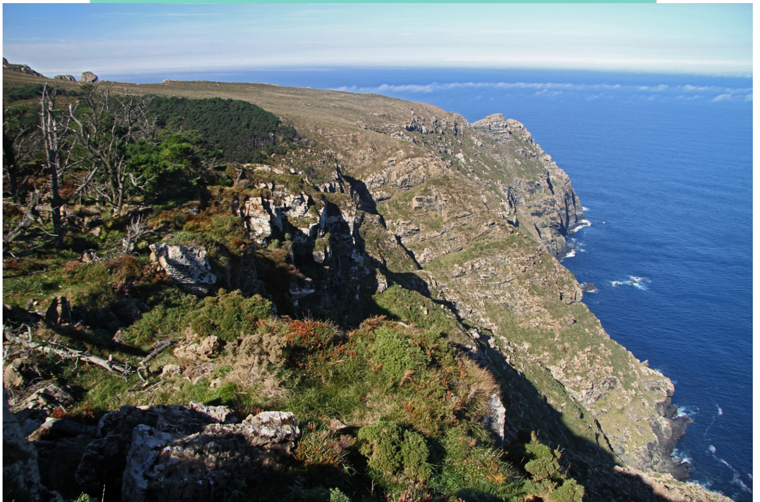
Punta e Chan do Limodo Limo desde o Alto da Vacariza.