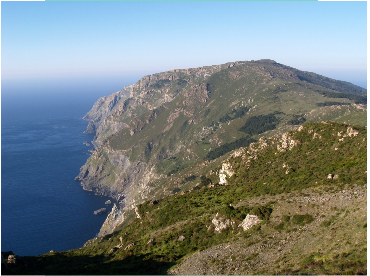
Cantís e monte do Limo desde o alto dos cantís do Cadro.