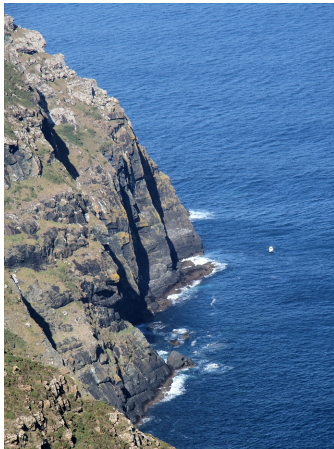
A altura do cantil da punta do Limo reduce a un punto o pequeno barco de pesca.