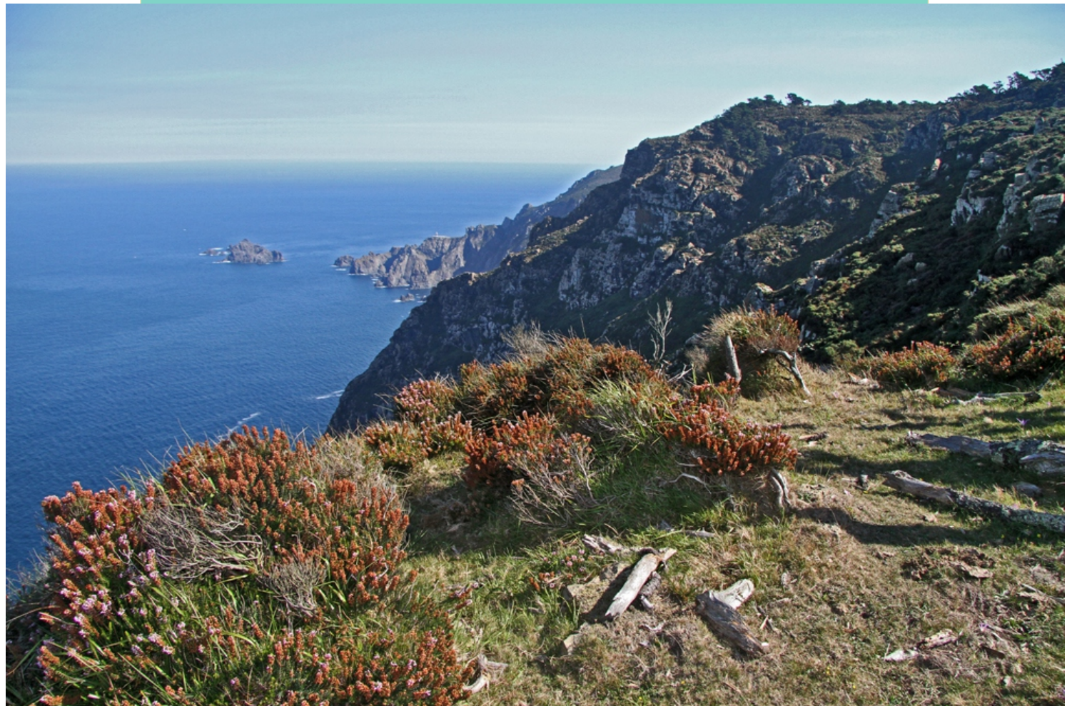
Costa da Vacariza