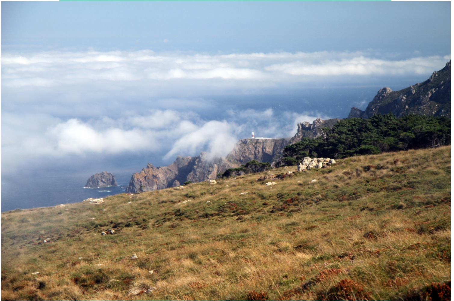
A néboa comezando a cubrir o Cabo Ortegal.